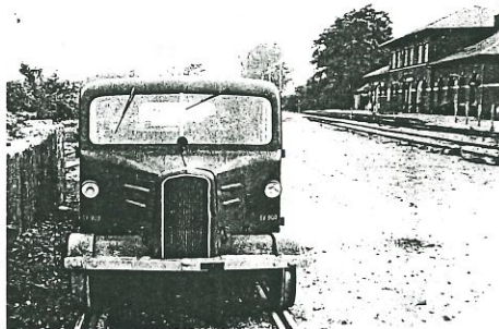
En tidligere DSB-dræsin i Store-Heddinge i 1979.

Der er ikke varmeapparat i Ford-vognen. Sørís er iført tykt skindtøj, og sektioningeniøren har et tæppe over knæene. Et tæppe, der har voldt de danske statsbaners generaldirek-