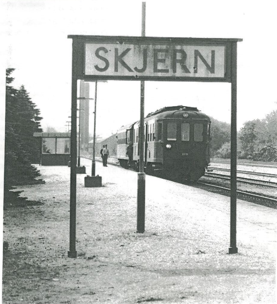
Mo 1870 med en Cis-vogn i Skjern, afventer udkørselssignal, i 1979.

Medlemsblad for VSVJ, Videbæk-Skjern Veteran Jernbane.