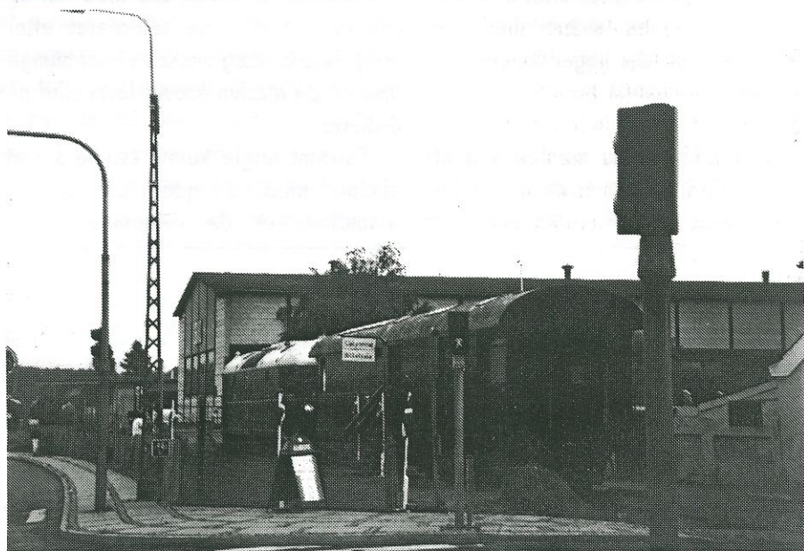
SFVJ's tog fra Ringe netop ankommet til Faaborg d. 16/7-1995

Billedet er taget ved SFVJ's nye holdeplads i Faaborg og med det, skal der lyde en fortsat god fornøjelse med læsningen af dette nummer af “Skinnecyklen”. Næste nummer påregnes at være i hænde hos medlemmerne, omkring d. 1. november.