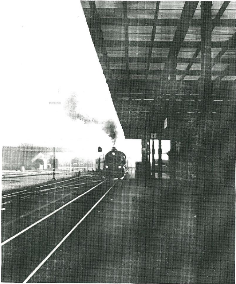
DSB litra R nr. 946 ankommer til Nyborg d. 18. oktober 1996, med et særtog for DSB Jernbanemuseum, Odense.

Medlemsblad for VSVJ, Videbæk-Skjern Veteran Jernbane.